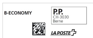
Invii singoli della Posta B