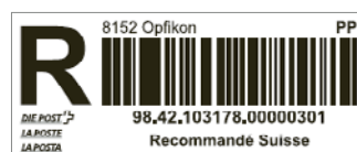
Lettere con codice a barre