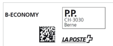
Invii in grandi quantità della Posta B