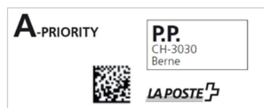
Invii della Posta A